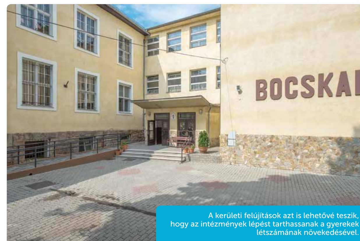
A kerületi felújítások azt is lehetővé teszik, hogy az intézmények lépést tarthassanak a gyerekek létszámának növekedésével.