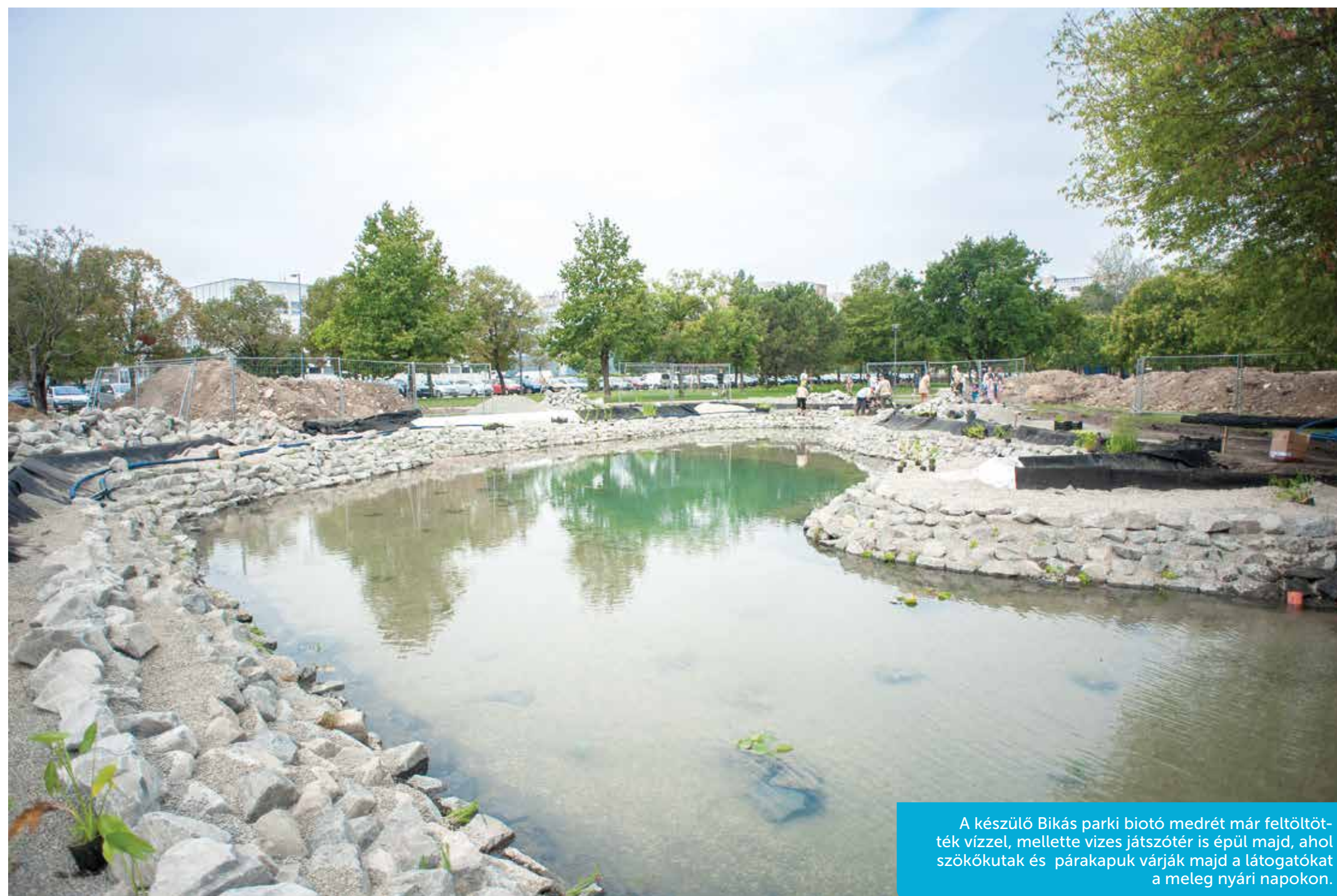
A készülő Bikás parki biotó medrét már feltöltötték vízzel, mellette vízes játszótér is épül majd, ahol szökőkutak és páraakapuk várják majd a látogatókat a meleg nyári napokon.

Az önkormányzat 2012-ben döntött úgy, hogy félmilliárd forintból több ütemben megújítja Újbuda legnagyobb közparkját. Tavaly elkészült a park úthálózata és járdarendszere, és a zöld felületeket is rendbe tették. Idén megépítik a sportpályák: két kosárlabda-, két streetballpályát és egy multifunkciós sportpályát kapott helyet a területen, utóbbihoz lelátó és pályavilágítás is készült. A kutyafuttatók is készen vannak, csak néhány játék vár még megépítésre.