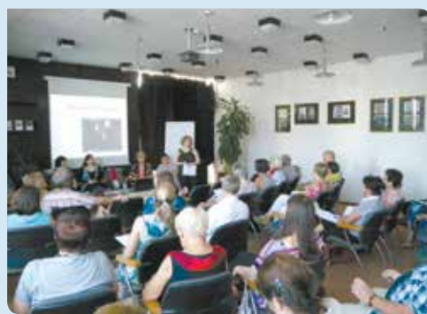
A „Mari néni” projekt legifjabb résztvevője 22, a legidősebb 83 éves

A sikeres nemzetközi találkozó a „Generációk közötti kommunikáció – gondolkodj, cselekedj, önkénteskedj együtt!” című európai uniós projekt keretében zajlott, melynek célja az idős és fiatalok párbeszédének, együttműködésének elősegítése. A nemzetközi rendezvény résztvevői két napot töltöttek az intézményben, hogy a projekt keretében indított helyi programokat megismerjék. A hazai kezdeményezéseket a csoportok tagjai mutatták be, így hitelesen és élményszerűen közvetítették a közös munka során tanultakat, tapasztaltakat.