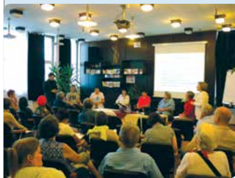
A Nagyi-diák tanulókör bemutatkozik

Nagy nyüzsgés volt a Budapesti Művelődési Központban (BMK) 2014. június 30. és július 1. között. Az előterek és termek megteltek francia, német, angol, lengyel, magyar szavakkal, a több mint negyven résztvevő barátságos beszélgetésével.