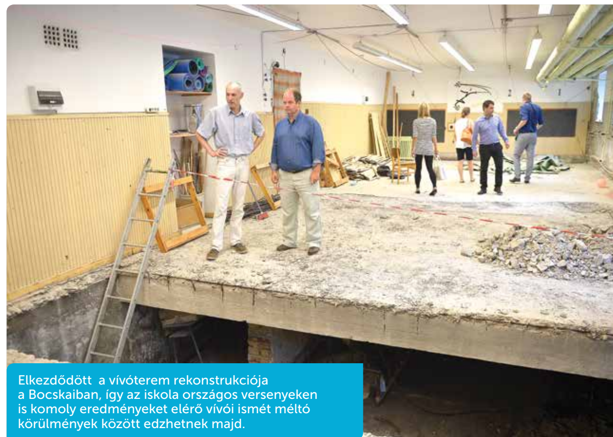
Elkezdődött a vívóterem rekonstrukciója a Bocskaiiban, így az iskola országos versenyeken is komoly eredményeket elérő vívói ismét méltó körülmények között edzhetnek majd.

Idén valósult meg a Bikás park közvilágításának teljes rekonstrukciója, így este is biztonságban lehet közlekedni az egész területen. Jelenleg is zajlik a biotó kialakítása, amely képes lesz gépek nélkül, természetes módon fenntartani önmagát. A tó medrét már feltöltötték vízzel, és épülnek a stégek is, amelyek természetközeli teszik a szieszázás élményét. A tó melletti központi részen vízes játéktér lesz majd, itt szökőkutak és páraakapuk szórakoztatják a kisebbeket a meleg nyári napokon. A Bikás új játszótérén is zajlanak a munkálatok, a régi pedig jövőre újul meg. A játszótér mellett zárt gyerekfoglalkoztatást hoznak létre, de a vízblokkokat rejtő kiszolgáló épület, a parkkörépület és a raktárak is épülnek. A kerület-